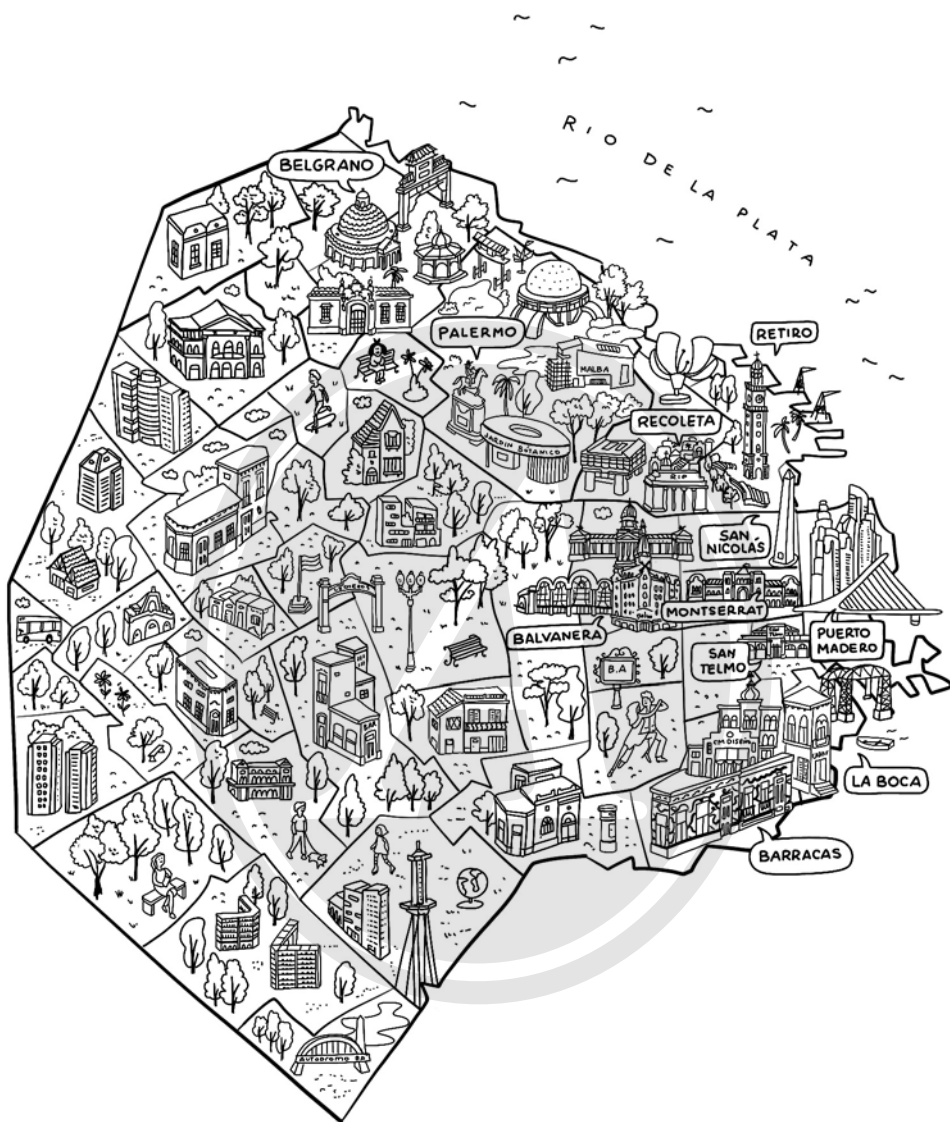
CIUDAD AUTÓNOMA DE BUENOS AIRES